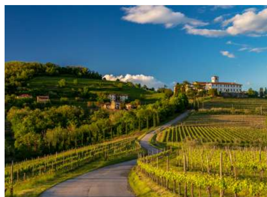
Dorf im Weinanbaugebiet Friaul-Julisch-Venetien

Die relativ junge und aufblühende Kellerei aus Cormòns mit 18 Hektar Rebfläche bietet klare und gradlinige, friaultypische Weine an. Cormòns ist ein traditionsreichen Ort im Collio-Gebiet (Friaul-Julisch Venetien). Die Weine wachsen auf sanften Hügeln, die von Mergel- und Sandsteinböden geprägt sind. Ronco dei Tassi erzeugt Weine, die ausdrucksstark, terroirbetont und die elegante Seite des friaulischen Weinbaus verkörpern.