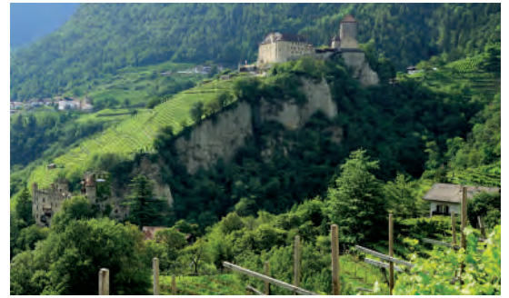
Die Kellereigenossenschaft bewirtschaftet eine Weinbaufläche von rund 220 Hektar

Um 1923 gründeten 23 Weinbauern die Kellereigenossenschaft Girlan. Heute bewirtschaften rund 200 Winzerfamilien eine Weinbaufläche von 220 Hektar. Die handverlesenen Trauben stammen aus den Anbaugebieten Girlan, Eppan, Montiggel, Montan und Mazon. Mit viel Engagement, Motivation und Nachhaltigkeitskonzept werden hier echte Südtiroler Weine für hohe Qualitätsansprüche hergestellt.