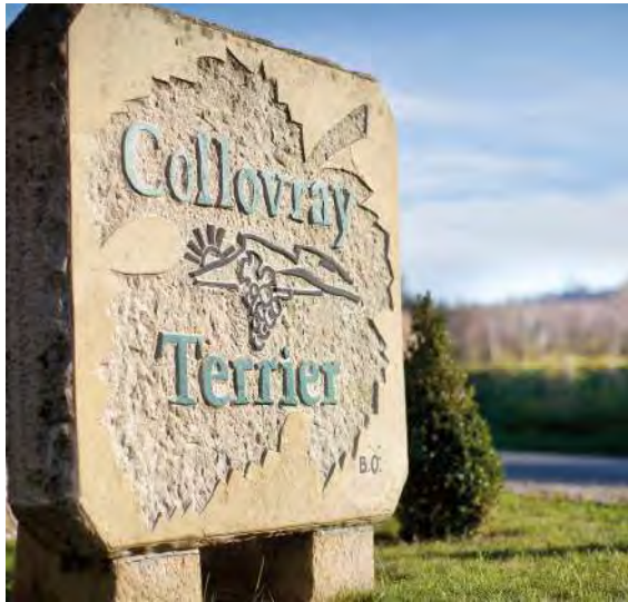
Domaine Collovray & Terrier liegen mit ihren mehr als 50 ha Weinbergen in der südlichen Bourgogne