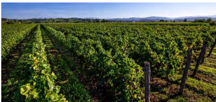
Weinberge von Pierpaolo Pecorari

Die Pecoraris sind Winzer aus Tradition und folgen einer essentiellen landwirtschaftlichen und önologischen Philosophie ohne Umschweife. Die reinsortigen Weine sind geprägt von großer Mineralität und einer erlesen sortentypischen Übereinstimmung.