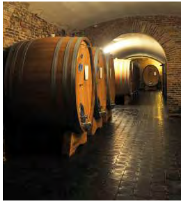
Blick in den Weinkeller