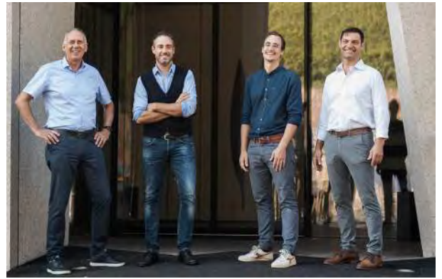
Das Führungsteam von Kurtatsch

Die Weinberge der berühmten Kellerei Kurtatsch liegen zwischen 220 und 900 Metern – das sind fast 700 Meter Höhenunterschied in nur einer Weinbaugemeinde. Diese für Europa einzigartige Konstellation schenkt den Erzeugern eine große Vielfalt an Terroirs. Das unterschiedliche Zusammenspiel aus Klima, Boden, Höhenlage und Sonnenausrichtung, lässt so für jede Rebsorte die idealen Anbau- und Ausdrucksbedingungen finden.