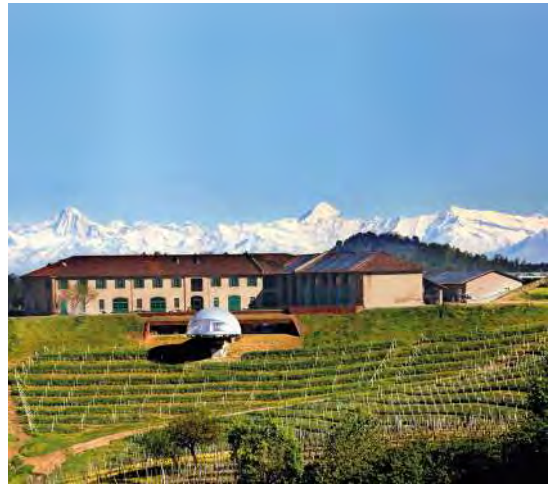
Das Weingut der Familie Ceretto bei Alba