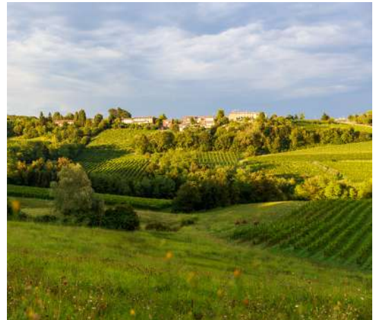
Über 30 Hektar Weinanbaufläche zählen zum Weingut Tenuta Sant'Antonio