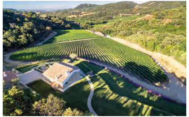
Blick auf die Weinberge und das Gut Siddùra

Das Privat-Gut Siddùra gehört seit Jahren zur italienischen Weinelite. Das sardische Gut liegt in der Nähe des mittelalterlichen Städtchens Luogosanto, im Herz der Gallura. Siddùra entstand aus dem innigen Streben nach Perfektion, Harmonie und Qualität. Es wird umweltschonend gewirtschaftet. Eine perfekte Oenologie sorgt für die hervorragende Qualität der Siddùra-Weine, die eine klare Identifikation mit dem Terroir vorweisen.