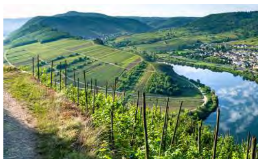
Beste Weinbergslagen in Rheinhessen.

Terra Blanc und Terra Noir stehen für die außergewöhnlichen Böden und das besondere Mikroklima der besten Weinbergslagen in Rheinhessen und der Pfalz. Die Trauben aus unseren Weinbergen werden nach strengen Qualitätsvorgaben angebaut. Anschließend wird der Wein in unserer Privat-Kellerei mit modernster Kellertechnik und temperaturgesteuertem Ausbau nach perfekter Reife auf Flaschen gezogen. Die Weine der Linien sind exklusiv nur für die Gastronomie und den ausgesuchten Fachhandel erhältlich.