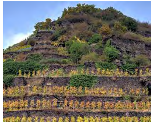
Brogsitter Weinbergterrassen im Ahr-Weinort Walporzheim

Das felsige Terroir und die Schieferböden im Ahrtal verleihen den Weinen feine mineralische Noten. Gepaart mit Frische und Harmonie entsteht ein besonderer und unverwechselbarer Stil, den die Weißweine von Brogsitter exzellent widerspiegeln.