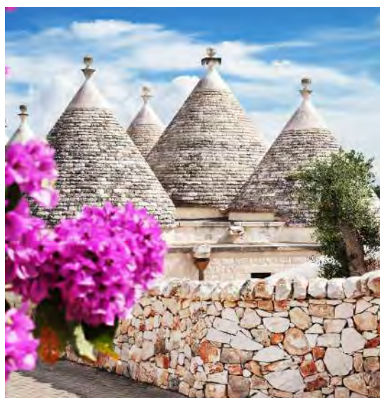
Dorf in Apulien

Die Cantine San Marzano ist für seine hochwertigen Weine und die Verbindung von Tradition und Innovation bekannt. Gegründet 1962 von 19 Winzern in San Marzano di San Giuseppe, liegt das Weingut im Zentrum der Primitivo di Manduria DOP. San Marzano bewirtschaftet Weinberge mit bis zu 80 Jahre alten Rebstöcken. Diese alten Reben liefern Trauben von hoher Konzentration und Komplexität, die den Weinen Tiefe und Charakter verleihen.