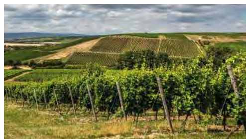
Weinberge in Bestlage

Die beliebten deutschen Weißwein-Spezialitäten werden von unseren Winzern in Rheinhessen und der Pfalz nach strengen Qualitätsvorgaben angebaut und mit größter Sorgfalt gelesen und selektiert. Anschließend werden die Spätlesen in unseren Privat-Kellern vinifiziert und nach perfekter Reife auf Flaschen gezogen.