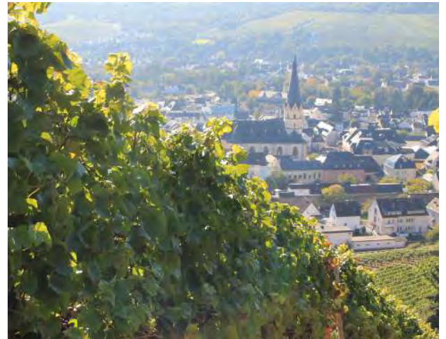
Blick auf Ahrweiler

Das Weingut Brogsitter wurde neben vielen anderen Auszeichnungen als „Weingut des Jahres 2009“ als erstes Weingut überhaupt im Aral Schlemmer Atlas ausgezeichnet. Belohnt wurden die besonderen Anstrengungen und die beachtlichen Investitionen in den vergangenen Jahren – sowohl Neuanpflanzungen in den Weinbergen als auch in die Modernisierung der Gärtanks und der Kellertechnik. Ebenfalls dazu gehört das historische Gasthaus Sanct Peter in Walporzheim.