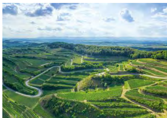
Weinberge des sonnenverwöhnten Kaiserstuhls

Genießen Sie unsere Burgunderweine von Weinbergen des sonnenverwöhnten Kaiserstuhls in Baden – der südlichsten Weinregion Deutschlands! Die Region erstreckt sich über 400 Kilometer von der Schweizer Grenze bis an die Taubermündung bei Wertheim. Die Reben gedeihen auf den Lösslehmböden des Eichstetter Vulkanfelsens. Die quarz- und kalkhaltigen Böden eignen sich durch ihren Mineralienreichtum und die poröse Struktur hervorragend für Burgundersorten.