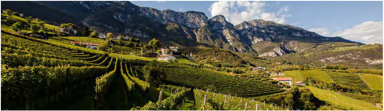
Weinbau zwischen 220 und 900 Höhenmeter