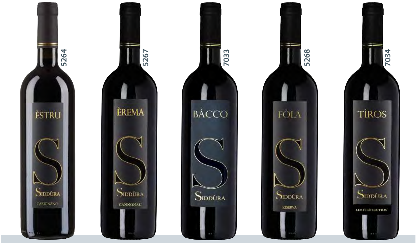
Außenansicht Spitzenweingut Siddùra