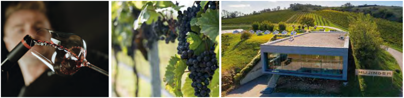
Blick auf das Weingut Leo Hillinger