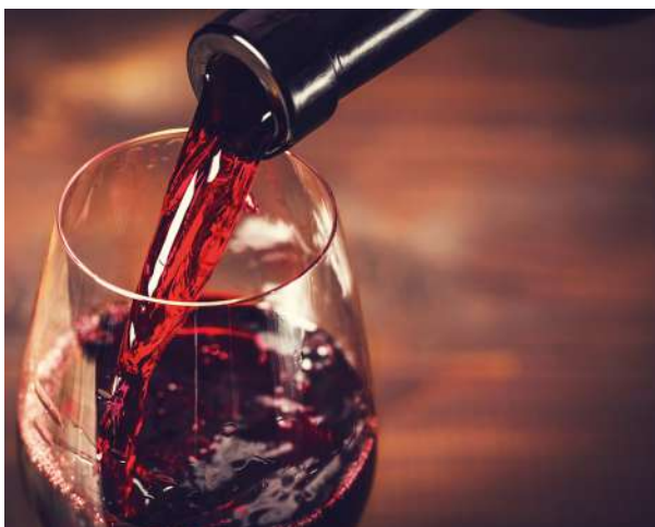
Weinprobe in der BROGSITTER-Vinothek