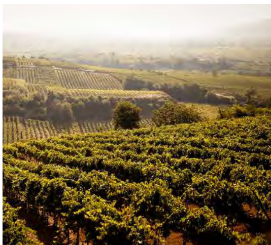
Terre Stregate erzeugt hochwertige Weine aus autochthonen Rebsorten.

Das kampanische Gut Terre Stregate ist in Guardia Sanfrankondi beheimatet. Hier im Zentrum des Weinbaus Kampaniens werden hochwertige Weine aus autochthonen Rebsorten wie Falanghina und Aglianico erzeugt. Vulkanische und kalkhaltige Böden prägen die Mineralität der Weine. Das mustergültige Unternehmen hat in kürzester Zeit seinen Falanghina in internationale Dimensionen gehoben.