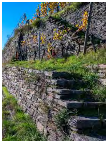
Weinbergsmauer bei Ahrweiler