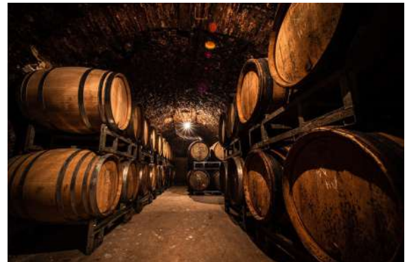
Blick in den Weinkeller von J.M.Gobillard & Fils