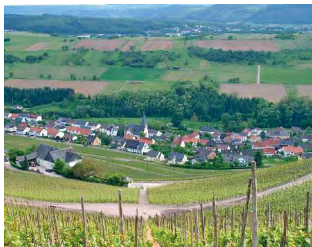
Die Riesling-Weinberge an Mosel und Saar bieten ideale Bedingungen für die Weine aus dem Hause BROGSITTER.

Die Önologen und Winzer von Brogsitter verstehen sich zu Recht als Riesling-Spezialisten. Unter ihrer Obhut findet die spät reifende, edle Weißweintraupe ideale Anbaubedingungen an den steilen Ufern der Mosel und Saar. Die steilen Schieferhänge speichern die Sonnenwärme und geben sie nachts wieder ab. Die Wurzeln der Reben dringen tief in den Boden, um sich mit Wasser und Mineralien zu versorgen. Die Trauben werden in den Brogsitter Privat-Kellern vinifiziert.