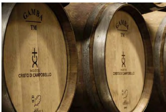
In Eichenfässern lagert der Wein von Cristo die Campobello.