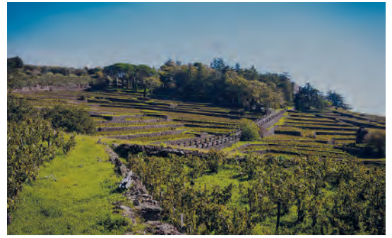
Weinberge von Castello Solicchiata

Castello di Solicchiata ist ein berühmtes historisches Weingut und gilt als Ursprung des Qualitätsweinbaus auf Sizilien. Es wurde im 19. Jahrhundert von Lucien Murat, dem Schwiegersohn von Napoleon Bonaparte, gegründet. Die Weine von Castello di Solicchiata sind weltweit begehrte Raritäten! Sie werden deutlich länger und nach Bordeaux-Vorbild ausgebaut und sind mit einem enormen Reifepotenzial ausgestattet. Die Weinberge des historischen Gutes liegen auf Lava- und Vulkanböden auf bis zu 800 – 1.000 Metern Höhe am Hang des Ätnas.