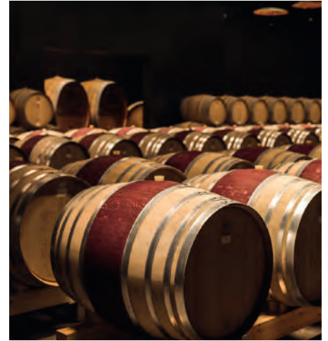
Blick in den Weinkeller von Pieropan

Die Società Agricola Pieropan ist ein herausragendes Weingut aus dem Veneto, das für seine exzellenten Weißweine, insbesondere aus der Garganega-Traube, bekannt ist. Das Weingut bewirtschaftet hauptsächlich Rebflächen in der Soave-Classico-Zone. Seit vielen Jahren schon wird auf biologischen Anbau gesetzt. Pieropan gehört zu den wenigen Produzenten, denen es wirklich gelungen ist, sehr hochwertige Soave zu kreieren. Die Weißweine zeichnen sich durch Finesse, Frische und Mineralität aus. Auch die Rotweine aus dem Valpolicella-Gebiet, wie Amarone und Recioto, sind von hoher Qualität.