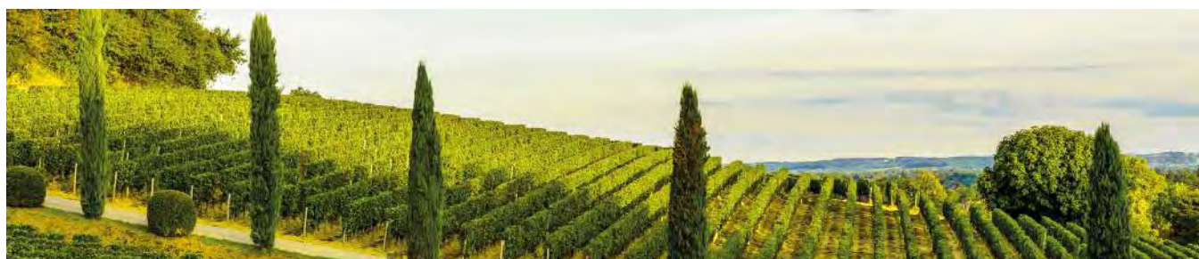
Sonnenverwöhnte Burgunder-Cru-Lagen von Méo-Camuzet