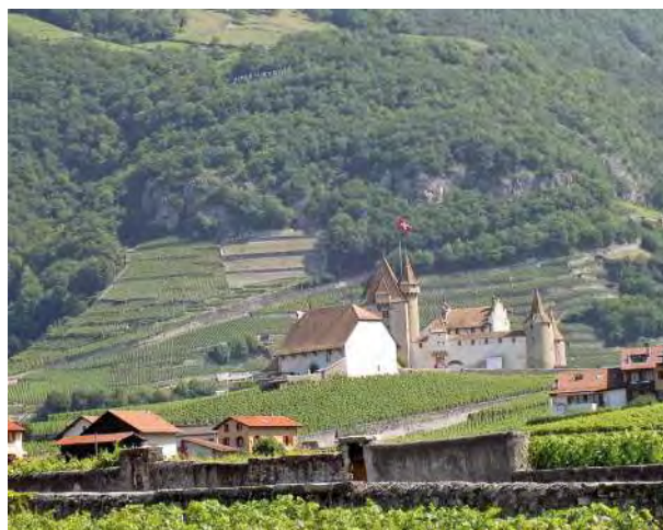
Blick auf die steilen Terrassenlagen von Henri Badoux